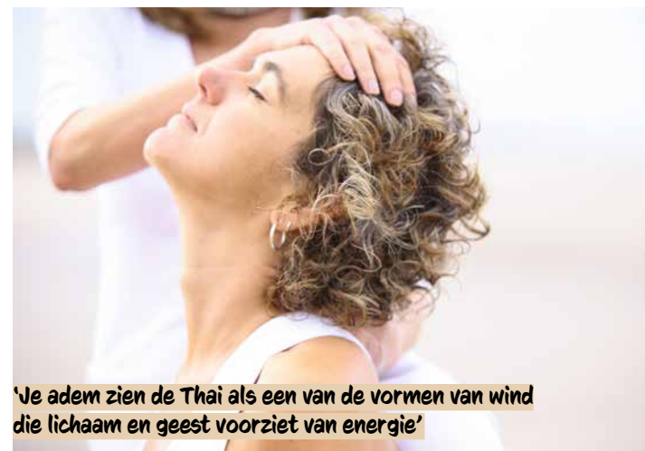
'Je adem zien de Thai als een van de vormen van wind die lichaam en geest voorziet van energie'

Tenslotte speelt ook de adem een rol bij het voeden van deze levensenergie.